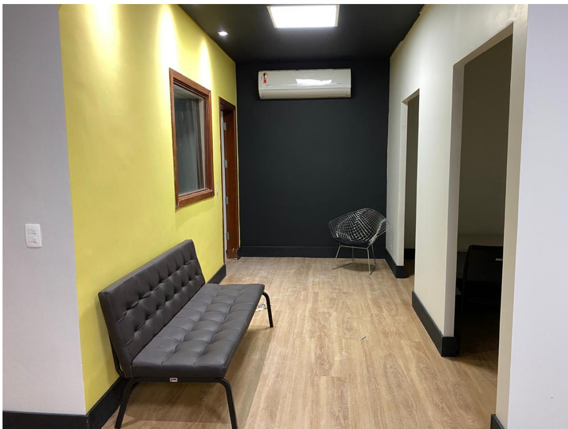
Parede instagramável (preta)

Tamanho: 275cm de altura x 212cm de largura